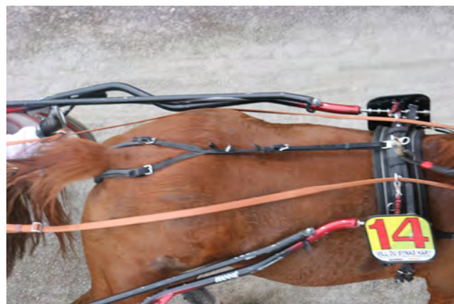
Annorlunda vy över en travhäst.