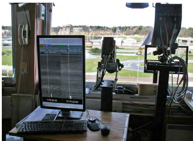
Inside domartornet med målfotokameran.