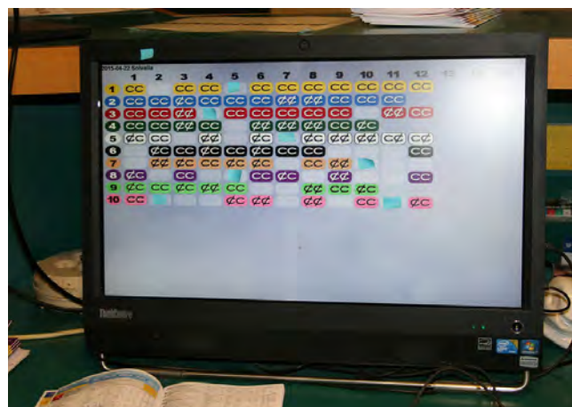
Schema över vilka hästar som ska tävla barfota och vilka som ska tävla med skor.