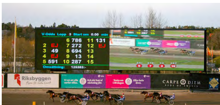
Positionerna intas på "bortre lång".