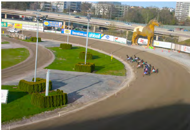
Utsikt från domartornet.