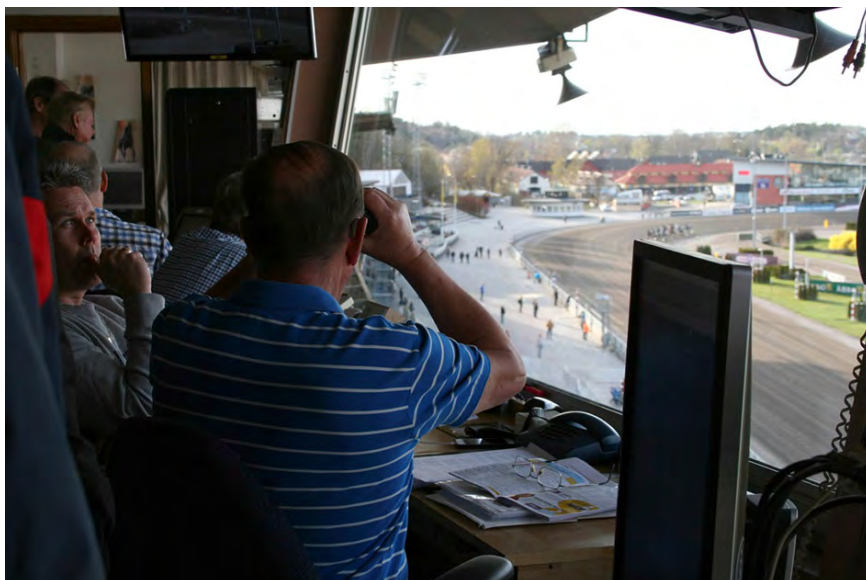
Utsikt från domartornet.

Avslutningsvis - innan det välför- tjänta kaffet med tårta - gjordes på eftermiddagen ett besök i Brandts hovslageri. En intressant djupdyk-